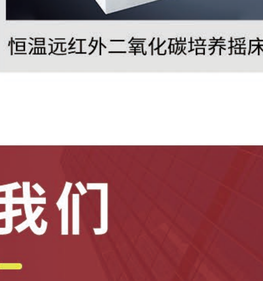
恒温远红外二氧化碳培养摇床