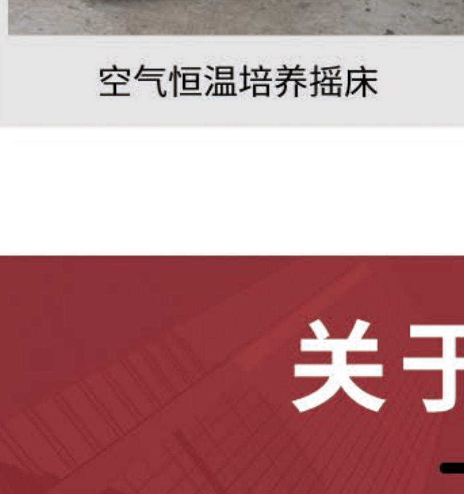
空气恒温培养摇床