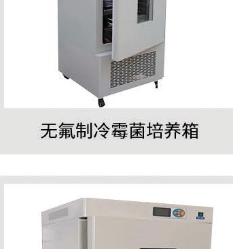
无氟制冷霉菌培养箱